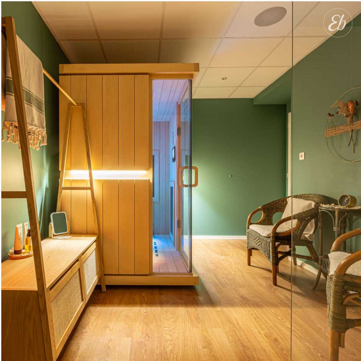
Cabine Infrarouge privatisée ciblant nombre de vos besoins de santé ; une invitation à la relaxation ...